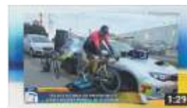
Ciclista quebra recorde mundial, atinge 202 km/h na BR-277 23.471 visualizações.