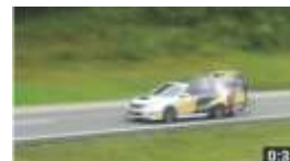
PRF escolta recordista 55.694 visualizações.