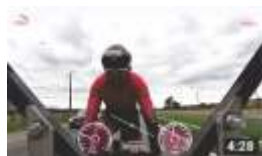
BIKE FASTEST 202 KM/H 5 milhões de visualizações.

MAIS DE 30 MILHÕES DE VISUALIZAÇÕES NO YOUTUBE E REDES SOCIAIS