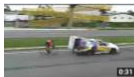
Recorde Mundial Ciclista Evandro Portela 122.358 visualizações.