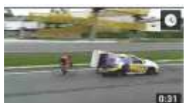
Ciclista Paranaense Chega a 202 km/h e Bate Recorde 427.713 visualizações.